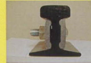
ペーシ （レールの継目板）