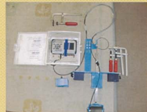
レールレベル測定器